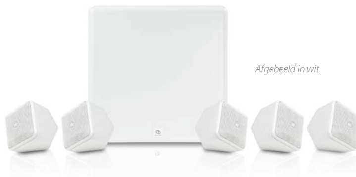
Afgebeeld in wit

Veel fabrikanten ontwerpen hun producten op basis van standaardcomponenten die door derden worden geleverd. Boston Acoustics ontwerpt elk component van elk systeem zelf zodat het voldoet aan de hoogste prestatienormen (die van ons). Natuurlijk is prestatie slechts een manier om waarden te meten. Daarom bouwen wij al onze producten heel zorgvuldig samen met absolute aandacht voor alles, van de materiaalkeuze tot en met de details van montage en afwerking. Op die manier weten we de verwachtingen van de serieuze luisteraars al bijna dertig jaar te overtreffen.