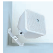
elke hoek elk oppervlak overal