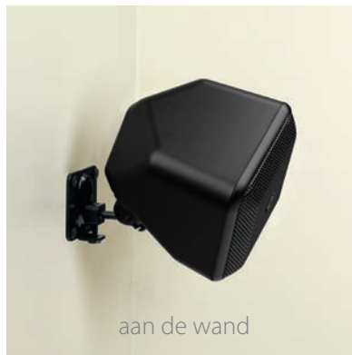
aan de wand